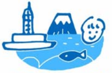
海のみらい静岡友の会